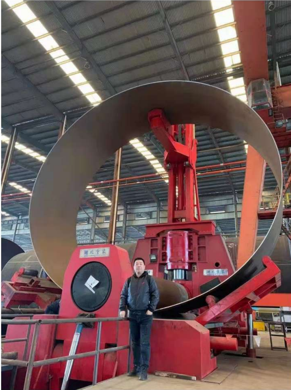
我公司为南通中集太平洋海洋工程公司设计、制造的 EZW11S-140×4000mm 风电塔筒专用卷板机（带输送辊道、顶支撑及侧支撑） EZHONG EZW11S-140×4000mm wind power tower plate bending machine (with conveyor roller, top support and side support) designed and manufactured for Nantong CIMC Pacific Ocean Engineering Company