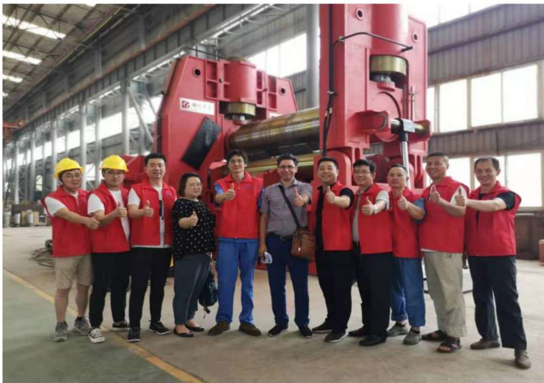
出口伊朗的 EZW11-120×3000mm 液压、微控三辊卷板机

EZW11-120×3000mm hydraulic, micro-control three-roll plate rolling machine exported to Iran