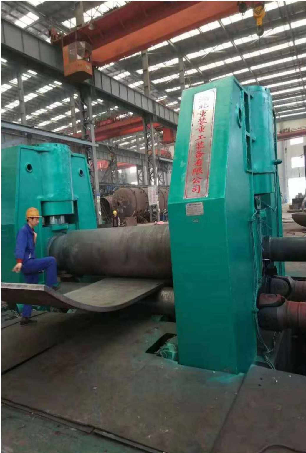
我公司为河南三门峡化工机械有限公司制造的 EZW11S-150*3200 水平下调三辊卷板机 EZW11S-150*3200 Horizontal Downward Three-Roll Plate Rolling Machine manufactured by EZHONG for Henan Sanmenxia Chemical Machinery Co., Ltd.