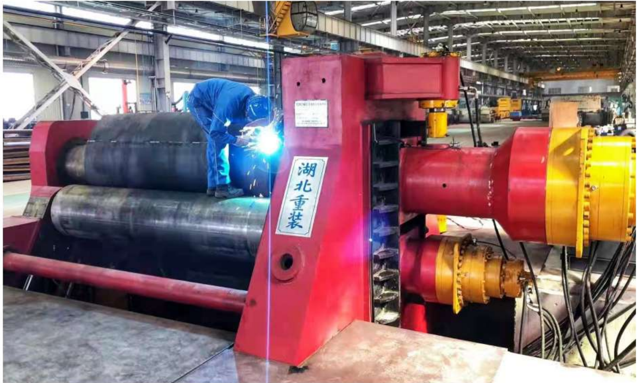
2021 年我公司为中铁十六局唐山曹妃甸重工设计、制造的 EZW12-80×3000Y 液压四辊卷板机

In 2021, our company will design and manufacture for the China Railway 16th Bureau Tangshan Caofeidian Heavy Industry EZW12-80×3000Y Hydraulic 4 Rolling Plate Bending Machine