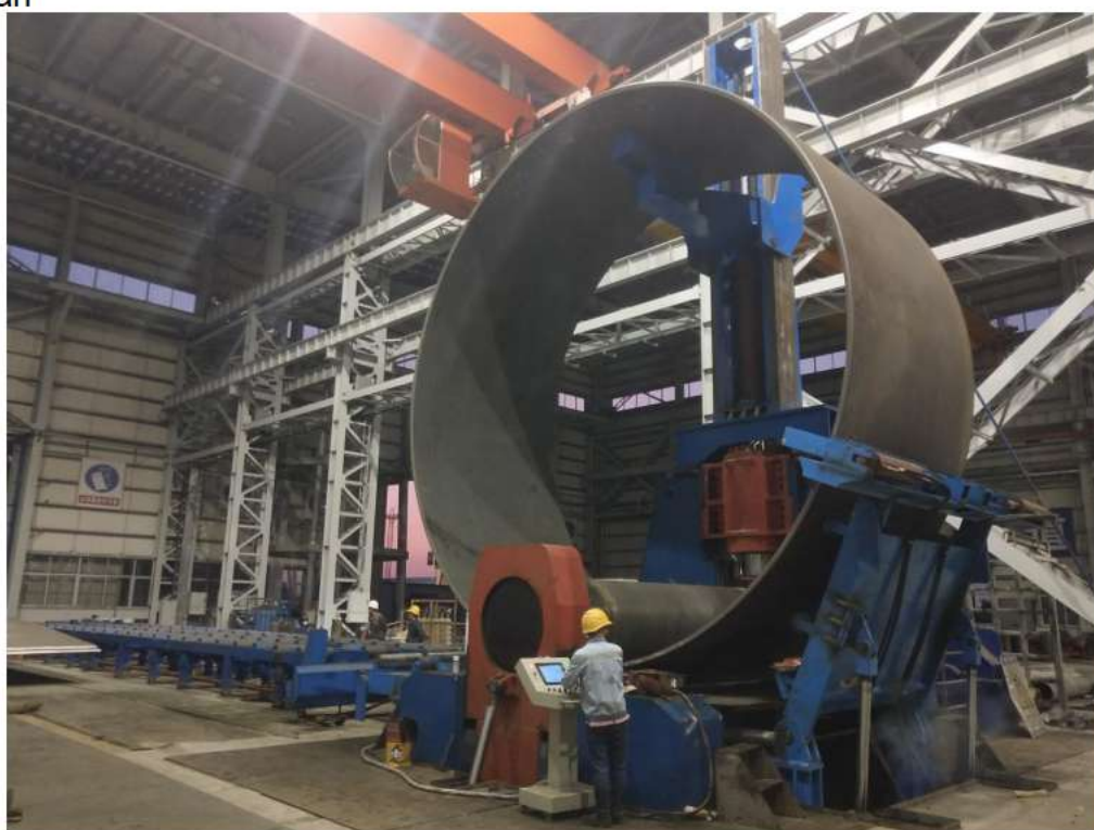
EZW11S-160×3200mm 风电塔筒专用卷板机（带输送辊道、顶支撑及侧支撑）

EZW11-120×3000mm hydraulic, micro-control three-roll plate rolling machine exported to Iran